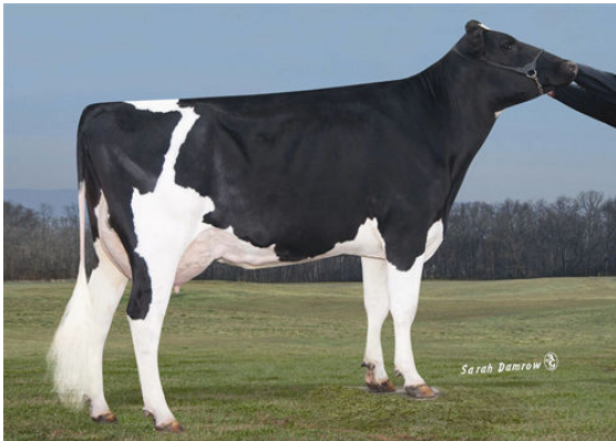
LARCREST CLEVELAND Dam